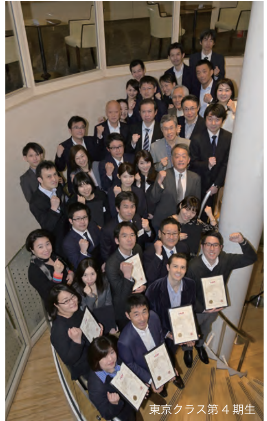
東京クラス第4期生