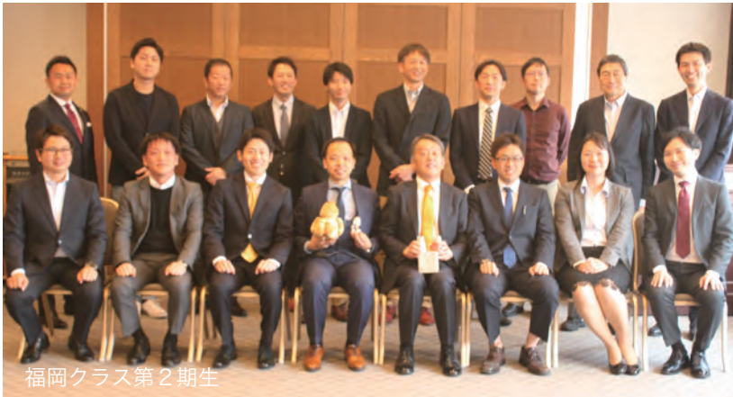
福岡クラス第2期生

2019年3月23日(土)に東京クラス第4期生、同年4月20日(土)に福岡クラス第2期生の卒業式を開催しました。今年は東京クラスでは26名、福岡クラスでは13名が卒業を迎え、講師及びOBOG会(B-EAT)の皆さまも駆けつけてくださり、温かい雰囲気にも包まれた素晴らしい卒業式となりました。